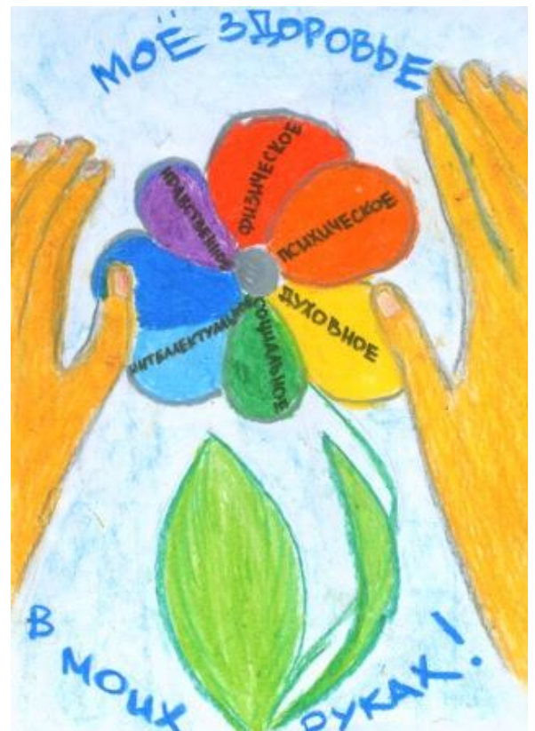
Коллективная работа учащихся 3-г, 3-с, 4-с классов