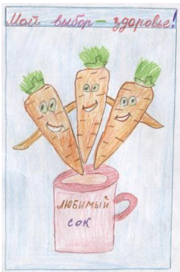
Олеся Бутусова, 2-а класс

Работы обучающихся МБОУ СОШ № 40 г.Липецка, выдвинутые на конкурс: